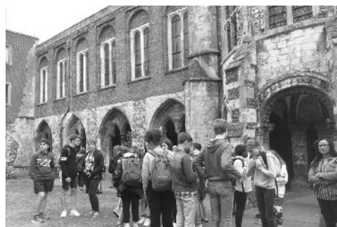
Camp itinérant Écosse-Angleterre