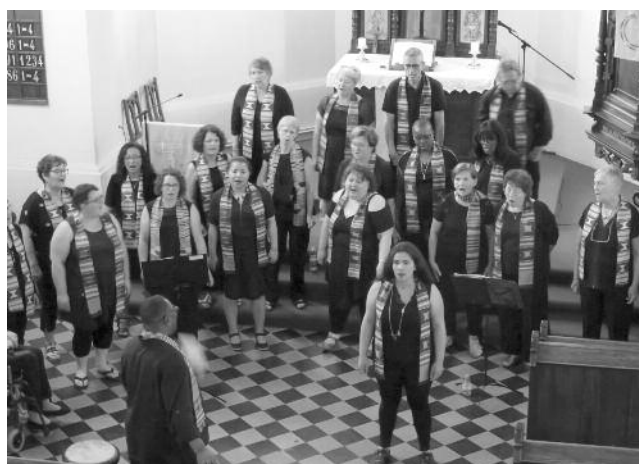
21/06/2019 Concert Gospel