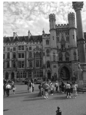
Cathédrale de Canterbury

Des temps ludiques (grand prix de quizz, films, jeux de société...) et sportifs (Tek, balle au camp) ont illuminé nos soirées et nos journées, donnant aux jeunes un temps de pause agréable, succédant aux journées de marche.