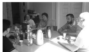
... et pause café