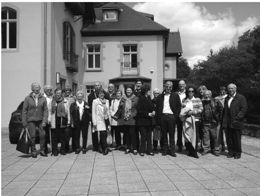
Sortie paroissiale au Luxembourg