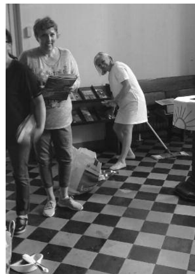
Nettoyage de l'église