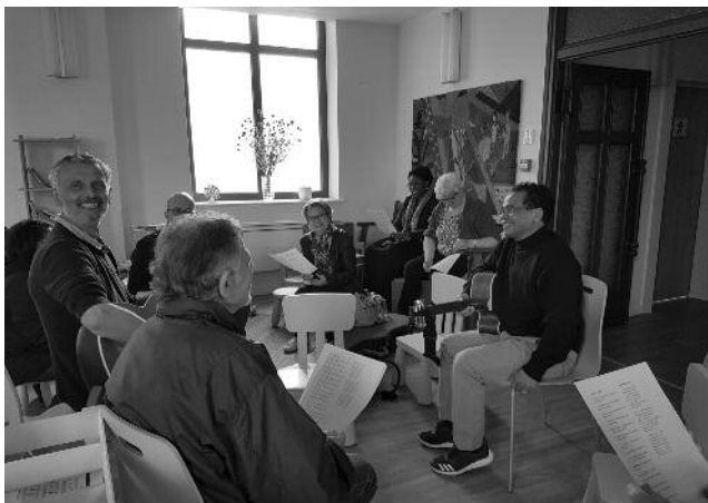
Journée des familles à Hagondange