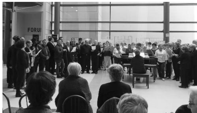
Fête de la fraternité à l'hôpital Mercy