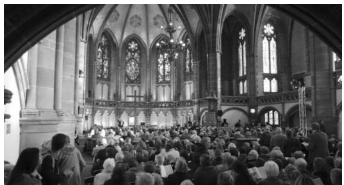
26/10/2019 Culte - journée UEPAL