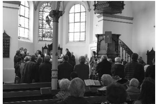
Culte de la Réformation