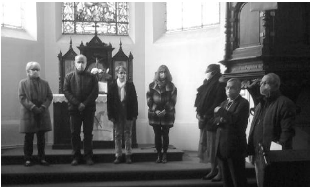
Remerciement des anciens conseillers