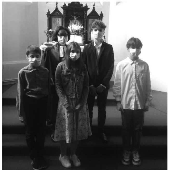
Culte de confirmation - 23 mai 2021