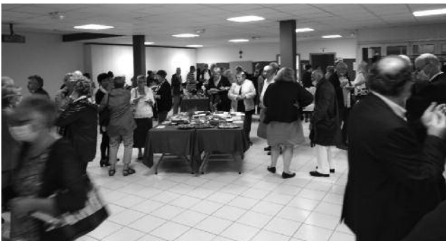
Convivialité après le culte de départ dans la salle paroissiale