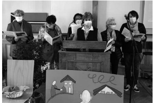
Célébration de la JMP - 22 mai 2021