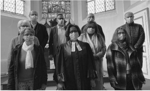
Installation du CP