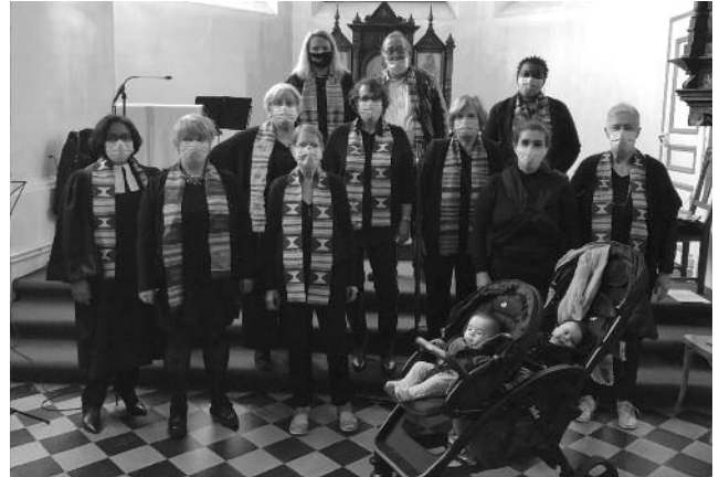
L'Atelier Gospel anime le culte de présentation - 16 mai 2021