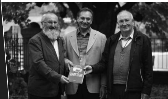
« Pour que plus rien ne nous sépare » par Claude Ducarroz, Noël Ruffieux, Shafique Keshavjee, éditions Cabédita, Suisse octobre 2017