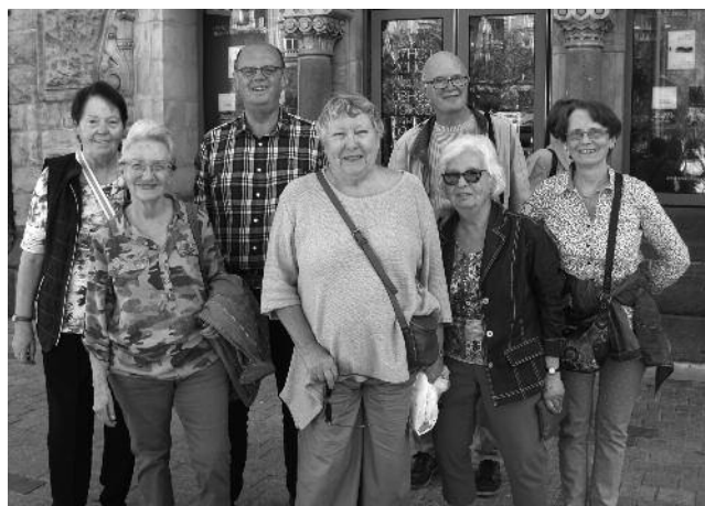
Visite de la Gare avec le café paroissial 27 septembre 2018