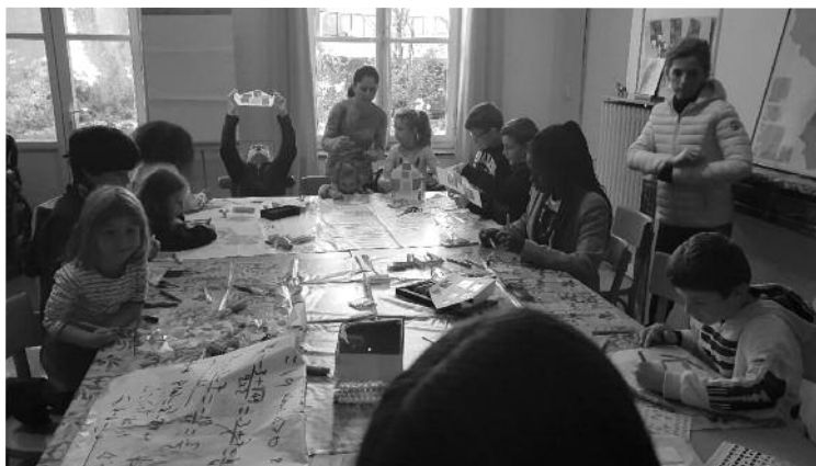
Rencontre avec le club biblique de Moyeuivre- Rombas