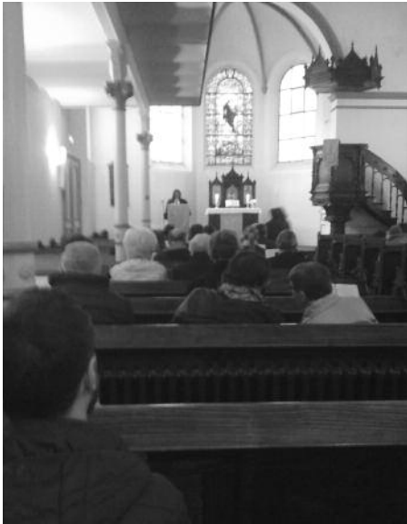
06/10/2019 Assemblée paroissiale