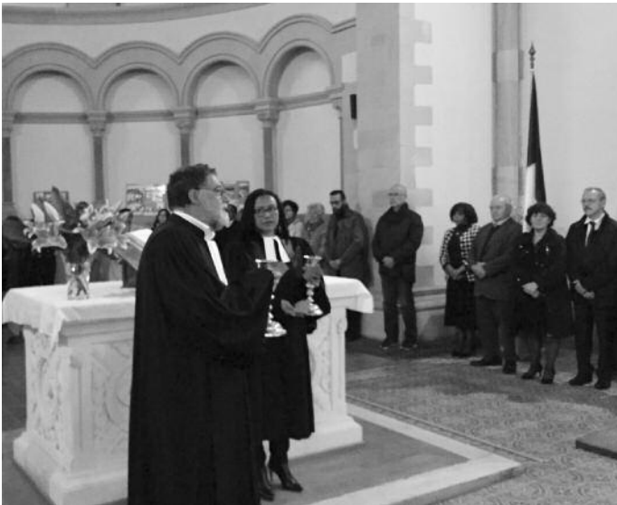
04/10/2019 Culte avec l'aumônerie militaire