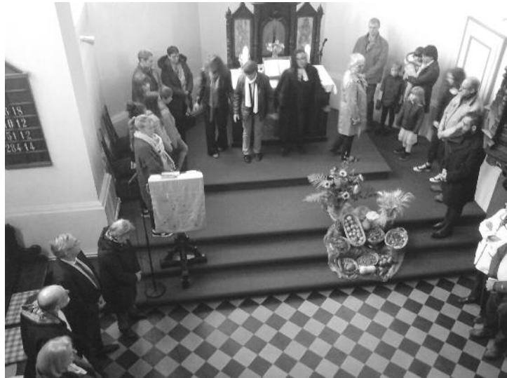
Fête des récoltes