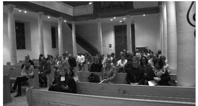
04/10/2019 Culte d'installation