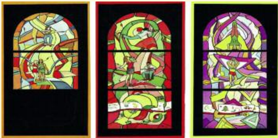
Les vitraux sur le côté gauche (Ouest)