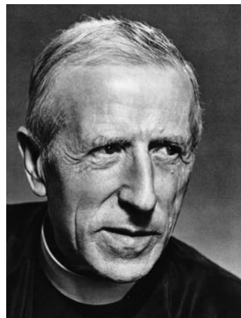
Pierre Teilhard de Chardin, né le 1er mai 1881 à Orcines dans le Puy-de-Dôme et mort le 10 avril 1955 à New York aux États-Unis, est un prêtre jésuite français, chercheur, paléontologue, théologien et philosophe.

« Seigneur nous pressentons que tu es toujours et partout autour de nous, mais un voile obscurcit nos yeux. Pour cela envoie nous ton Esprit, seul lui permet d'opérer notre Métamorphose ! »