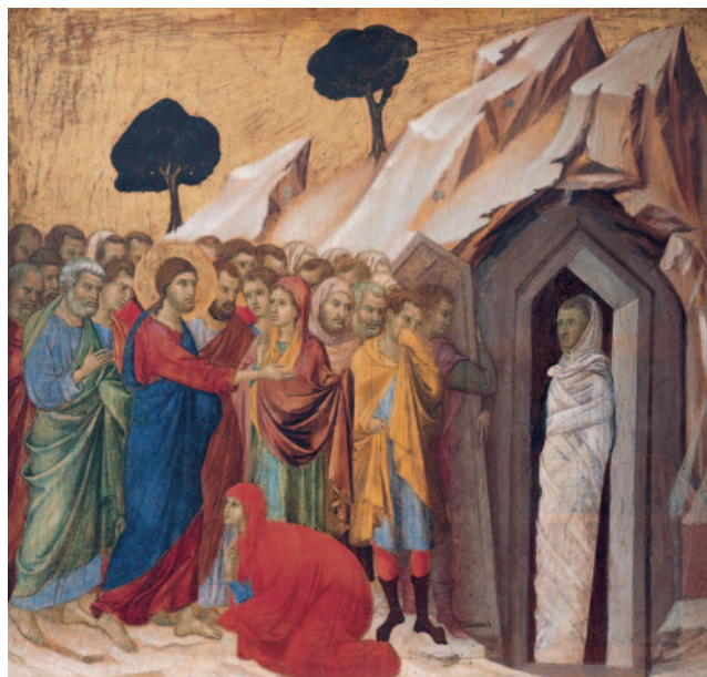
La Résurrection de Lazare, par Duccio (1310–1311), musée d'Art Kimbell.

Ainsi, lorsque Lazare sort du tombeau sur l'appel de Jésus, celui-ci délie ses liens, les bandeaux qui l'empêchent d'avancer, de respirer, de vivre. Jésus nous invite à nous