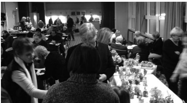
Concert solidaire par l'Ensemble Enos Tante Corde le 17/12/2023