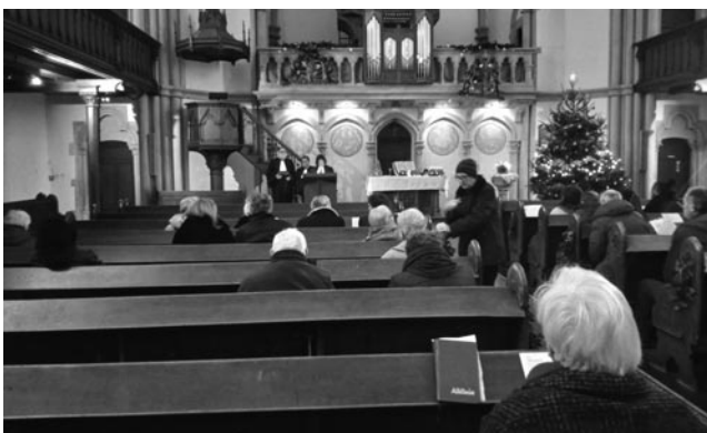
Culte commun à Montigny le 7/01/2024